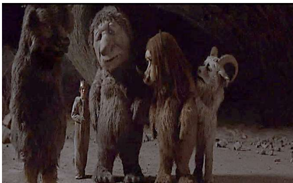
Figuur 6: Skermgrepe uit die film.