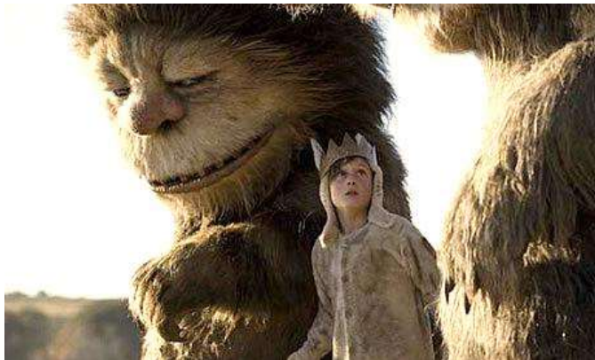
Figuur 1 Max tussen twee van die Wilde Dinge (2009)

Die toneel waar Carol Douglas se arm afruk kan beskou word as verteenwoordend van onderdrukking. Hier onderdruk een gedeelte van die onbewuste 'n ander gedeelte. Die rol van die emosie wat onderdruk word, word vergelyk met die liggaam van 'n karakter. Douglas se arm word later met 'n stok vervang, omdat Carol dit weggegooi het. Douglas se arm funksioneer nie meer soos dit vantevore het nie en