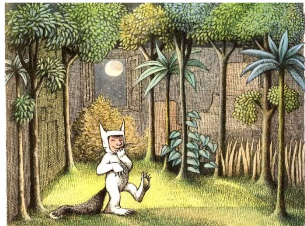
Figuur 2 Skets uit Sendak se kinderboek – Max in sy kamer/ die oerwoud.

Peter Bradshaw is van mening dat Spike Jonze die verwagtingshorison van die lesers van die kortverhaal gefnuik het. Verder beweer hy dat die donker en aggressiewe aard van die rolprent die psige van die jongkind effektief ontgin. Hy neem dit verder deur te sê dat “[i]t has been expanded into a full-length psychological study of childhood loneliness and dysfunction ...” (Bradshaw, 2009). Volgens hierdie resensie is die rolprent nie 'n fantasie-weergawe van die boek, soos in die geval van Cat in the Hat (2003) of Fantastic Mr. Fox (2009) nie. Hierdie rolprent eis 'n interpretasie wat verwyderd is van die oorspronklike boek: “[b]etween them, Jonze and Eggers have created an intriguing oddity whose fate it may be to fall between the sensibilities of adults and children” (Bradshaw, 2009). Bradshaw beklemtoon dus dat hierdie rolprent geskik en toeganklik is vir beide 'n volwasse- en kindergehoor.